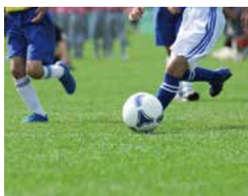
◎スポーツイベント