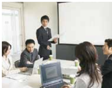
◎会議や営業からの帰社時